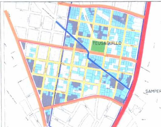
Inmuebles de Interés Cultural - MORFOLOGÍA EN PLANTA