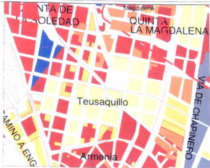
CRECIMIENTO HISTÓRICO - CRONOLOGÍA